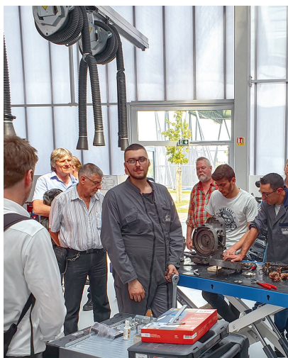
Austausch und Vernetzung: Berliner Bildungsexperten trafen französische Berufskollegen.